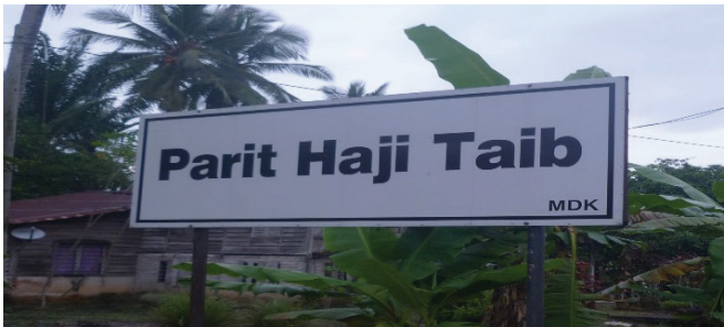
Rajah 4 Papan tanda Kampung Parit Haji Taib.

Kampung Parit Haji Taib merupakan sebuah perkampungan di mukim Bagan Serai iaitu di sekitar daerah Kerian, Perak Darul Ridzuan. Kampung ini mempunyai tiga subkampung, iaitu Parit Haji Taib Jalan Taiping, Parit Haji Taib 1 dan Parit Haji Taib 2.