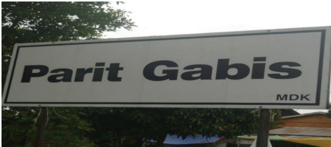
Rajah 5 Papan tanda Parit Gabis.