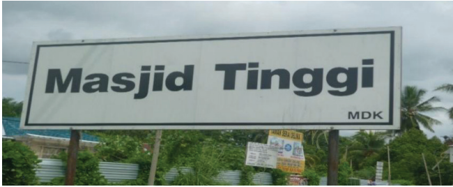
Rajah 3 Papan tanda Kampung Masjid Tinggi.

Kampung Masjid Tinggi dalam mukim Bagan Serai telah dipilih dalam kajian ini sebagai sumber utama untuk mendapatkan maklumat. Subkampung yang dipilih ialah Jalan Banjar, Kampung Masjid Tinggi.