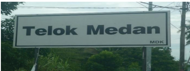
Rajah 6 Papan tanda Kampung Telok Medan.

Kampung Telok Medan ini mempunyai tiga subkampung, iaitu Kampung Batu 14, Kampung Parit Ali Kalang 1 dan Kampung Belakang Surau.