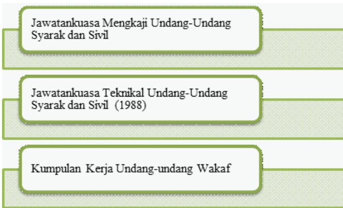
Rajah 5 Penubuhan jawatankuasa untuk penyeragaman undang-undang syariah oleh JAKIM.

Satu lagi langkah yang belum dilaksanakan oleh kerajaan persekutuan dalam usaha menyeragamkan undang-undang wakaf negara kita. Langkah tersebut ialah meluluskan Akta Wakaf untuk Wilayah-wilayah Persekutuan yang akan menjadi undang-undang contoh bagi pengurusan wakaf di negeri-negeri. Apabila usaha ini dilaksanakan, maka bolehlah Perkara 75 Perlembagaan Persekutuan diguna pakai bagi memantapkan lagi penyelarasan: