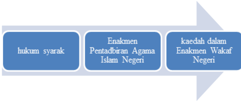
Rajah 1 Evolusi undang-undang pengurusan wakaf di Malaysia.

Sistem wakaf di Malaysia beroperasi di bawah kerangka tiga jenis undang-undang, iaitu hukum syarak, Enakmen Pentadbiran Agama Islam Negeri dan enakmen wakaf negeri seperti dalam Rajah 1: