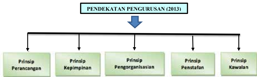
Rajah 1 Pendekatan pengurusan.

Prinsip-prinsip ini terbahagi kepada beberapa dimensi dan peringkat tertentu untuk menganalisis bahan sastera. Walau bagaimanapun, makalah