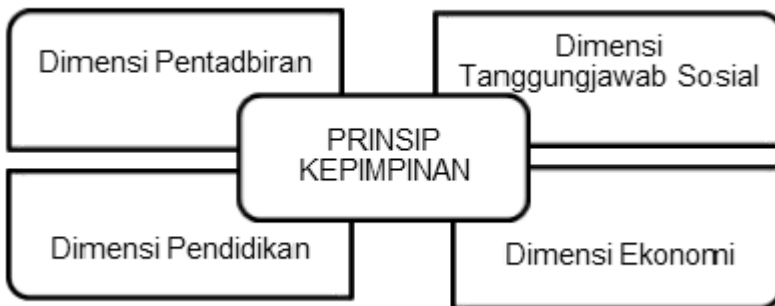
Rajah 2 Dimensi prinsip kepimpinan.

Dimensi pentadbiran amat besar pengaruhnya kerana kejayaan sesebuah organisasi bergantung pada prestasi pentadbirnya dalam erti kata lain yang memimpin harus mempunyai ciri-ciri khusus tertentu dalam menjalankan peranannya sebaik mungkin. Pentadbir juga wajar menguasai kemahiran yang diperlukan untuk mengelola ahli bawahannya bagi mencapai objektif dan matlamat organisasi. Newman (1951, p.56) dalam bukunya yang bertajuk Administrative Action , mendefinisikan pentadbiran sebagai bimbingan, kepimpinan dan kawalan daya usaha kumpulan pekerja ke arah pencapaian matlamat. Ramaiah (1999, p.69), melihat proses pentadbir sebagai fenomena proses manusia menggunakan kemahiran akal fikiran dan potensinya. Kedua-dua pandangan ini didapati menghubungkaitkan pentadbiran dengan pencapaian objektif dan matlamat organisasi. Secara tersirat, pentadbir harus memikirkan dasar, kaedah dan strategi terbaik dalam mengurus sistem pentadbirannya supaya objektif dan matlamat tercapai. Ringkasnya, dimensi pentadbiran memberikan fokus terhadap aspek, ciri dan teknik pentadbiran yang dipraktikkan oleh pemimpin bagi mencapai objektif dan matlamat