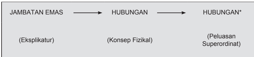
Rajah 1 Laluan inferens ( inferential route ) JAMBATAN EMAS.

denotasi fizikal dan psikologi. Oleh hal yang demikian, frasa JAMBATAN EMAS dan JAMBATAN PERAK, dibantu oleh analisis bentuk logik, andaian ensiklopedik dan kesimpulan ke hadapan yang munasabah ( plausible forward inference ) dapat diperluas kepada makna HUBUNGAN, yang seterusnya dapat difahami sebagai HUBUNGAN* setelah diaktifkan oleh konteks wacana dan jangkaan relevan ( expectations of relevance ). HUBUNGAN yang mempunyai fitur konsep asas fizikal menunjukkan hubungan logistik atau geografi, manakala HUBUNGAN* pula merujuk hubungan yang melibatkan perasaan, seperti pertunangan dan perkahwinan. Kriteria asas konsep ad hoc secara ringkasnya didefinisikan sebagai pemahaman yang diakses melalui konteks tertentu secara spontan oleh pendengar dalam proses memahami ujaran berdasarkan rujukan pragmatik. Bagi ungkapan atau leksikal yang berbentuk metafora dan bahasa figuratif, konsep ad hoc yang digunakan untuk memahami makna yang dimaksudkan ialah ad hoc peluasan (Carston, 2002). Rajah 1 disesuaikan daripada penerangan analisis yang dilakukan oleh Wilson dan Carston (2006) untuk memudahkan pemahaman proses peluasan ad hoc .