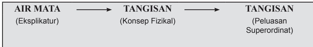
Rajah 4 Laluan inferens ( inferential routes ) AIR MATA.

Rajah 4 menunjukkan laluan inferens bagi eksplikatur AIR MATA kepada konsep asas fizikal, iaitu TANGISAN, dan seterusnya mengalami peluasan konsep superordinat yang tidak terhad pada konsep fizikal.