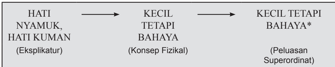
Rajah 3 Laluan inferens ( inferential route ) AIR PINANG MUDA.

Oleh itu, bagaimanakah berlakunya proses rujukan ke hadapan AIR PINANG MUDA yang menjadi konsep asas fizikal MABUK, NAFSU?