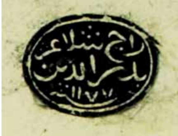
Rajah 2 Cap mohor Raja Selangor Badruddin