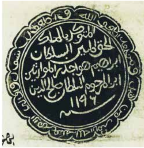
Rajah 3 Cap mohor Sultan Ibrahim.