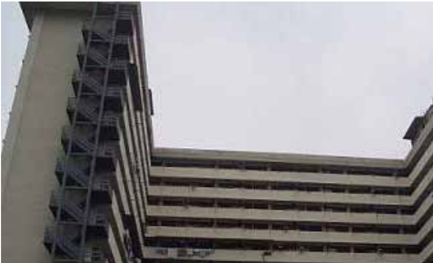
Rajah 1 Rumah pangsa 17 tingkat di Kampung Kerinchi, Kuala Lumpur.

Rumah pangsa 17 tingkat yang terletak di Kampung Kerinchi, Kuala Lumpur telah dipilih sebagai tempat kajian. Data berdasarkan soal selidik dan temu bual terhadap 47 buah keluarga Melayu berpendapatan rendah yang menetap di rumah pangsa tersebut. Kesemua responden merupakan masyarakat Melayu yang beragama Islam yang terdiri daripada guru, kerani, peniaga kecil, pemandu teksi, pekerja kilang dan buruh kasar.