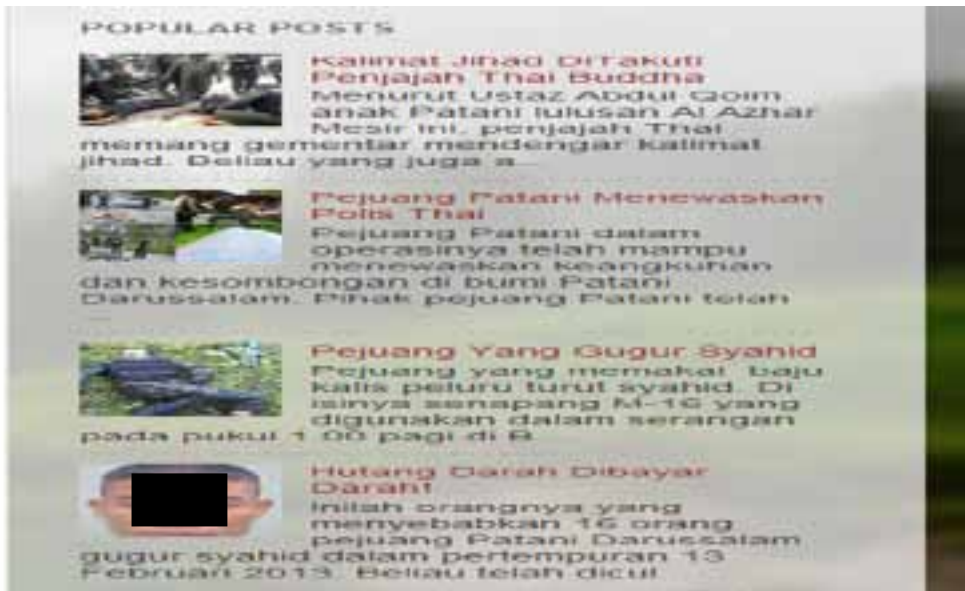
Rajah 3 Pembaca dalam laman web blog “Patani Darussalam Merdeka” ( http://pattanimerdeka.blogspot.com/ ).

di selatan Thailand yang berjumlah 320, antara 1 Januari hingga 22 Disember 2013. Pemaparan angka ini merupakan strategi retorik “logos”, iaitu apabila fakta digunakan untuk mempengaruhi pembaca. Dalam konteks ini angka ini bertujuan untuk mempengaruhi persepsi pembaca bahawa betapa berbahayanya pihak berkuasa selatan Thailand. Tentera atau kumpulan penyokongnya mempunyai keupayaan untuk melakukan letupan bom yang mengorbankan ramai yang tidak berdosa.