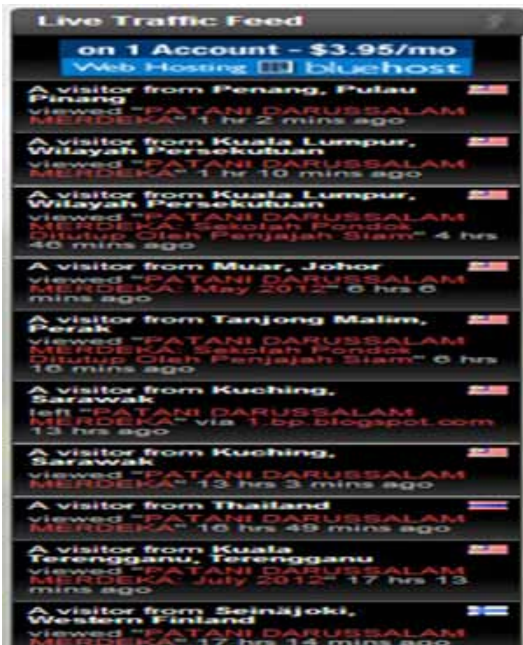
Rajah 6 Pengunjung yang boleh berbahasa Melayu boleh membaca dan memahaminya termasuk pembaca dari Finland.

Sebagai sebuah laman blog yang bersifat interaktif, pembaca blog ini dapat memberikan komen terhadap kandungan yang dimuat naik. Selain itu, pembaca dapat berinteraksi dengan admin dan pembaca yang lain. Namun, pembaca blog ini tidak langsung memberikan respons terhadap kandungan yang ada walaupun pengunjunnya sudah melebihi 57 000. Hal ini menimbulkan kehairanan mengapakah pembaca tidak memberikan respons kepada isi kandungan laman blog ini? Adakah respons itu dikawal oleh admin bagi mengelakkan respons pembaca yang terlalu provokatif sehingga boleh mengancam keselamatan admin? Adakah hal ini juga ada hubungan dengan keterbatasan pembaca khususnya Melayu Patani di selatan