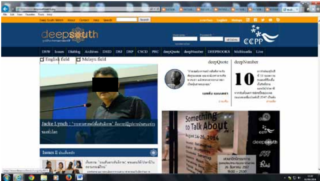
Rajah 9 Laman web “DeepSouth” ( http://www.deepsouthwatch.org/ ).

Thai mendominasi laman sesawang tersebut. Bahasa Melayu dan Inggeris hanya diberikan tempat atau ruang yang kecil. Mungkin admin laman sesawang ini percaya ramai pembacanya boleh berbahasa Thai dan mahu mereka dapat lebih memahami isu sebenar konflik yang berlaku. Dua ruangan telah dikhaskan untuk bahasa Melayu dan Inggeris yang dinamakan sebagai “Melayu Field” dan “English Field”. Kedua-dua ruangan ini mempunyai pelbagai makalah yang menyentuh pelbagai isu di wilayah selatan Thailand. Hal ini dapat dilihat melalui laman hadapan laman sesawang tersebut.