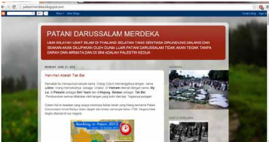
Rajah 1 Laman web blog “Patani Darussalam Merdeka” ( http://pattanimerdeka.blogspot.com/ ).

Foto yang berkaitan dengan pembunuhan kejam di Takbai telah dimuat naik dalam laman blog ini dengan strategi retorik patos, iaitu apabila admin blog ini berusaha untuk mempengaruhi emosi pembaca untuk bersimpati dengan mangsa dan marah dengan pihak berkuasa dengan menggunakan foto yang bersifat provokatif ini.