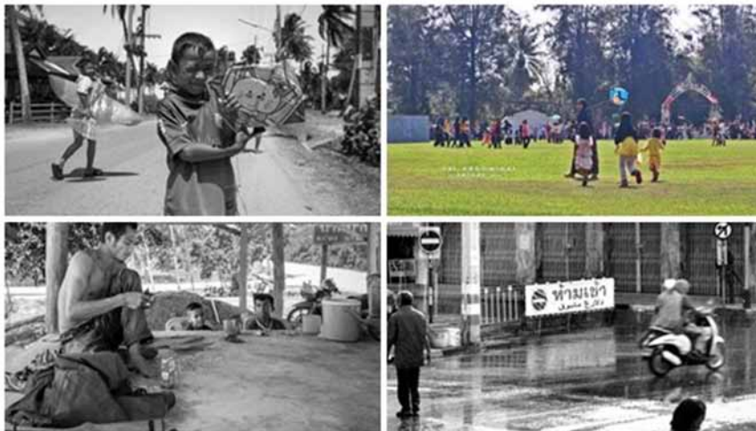
Rajah 10 Laman imej “ feeling good ” yang cuba dibentuk dalam ruangan Deepsouth melalui foto-foto yang dimuat naik.

Laman sesawang ini mempunyai pelbagai hiperpautan yang membolehkan pengunjung mendapatkan berita mengenai wilayah selatan Thailand. Laman ini mesra pengguna, terdapat pelbagai ciri yang ditawarkan kepada pengunjungnya. Selain itu, laman sesawang ini juga berbentuk interaktif, iaitu pengunjung dapat memberikan makalah kepada admin untuk disiarkan. Selain itu, ruangan untuk maklum balas juga disediakan kepada pengunjung. Laman sesawang ini dihasilkan dengan reka bentuk terkini.