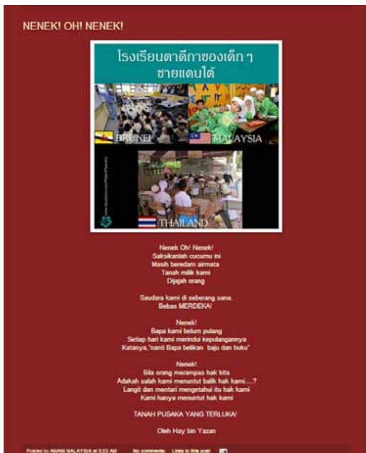
Rajah 13 Pautan video klip (termasuk puisi multimedia) yang terdapat dalam laman blog Aman Patani.

Puisi bebas ini menjelaskan bahawa Melayu Patani telah dijajah oleh pemerintah Thailand semenjak lama dulu. Mereka merintih tentang nasib malang yang menimpa. Melayu Patani masih menaruh harapan untuk merdeka daripada penjajahan tersebut. Mereka masih terus menuntut hak mereka. Generasi sekarang masih mengharap Melayu Patani bebas daripada cengkaman penjajah. Oleh sebab laman sesawang ini dikendalikan oleh admin dari Malaysia maka nada provokatifnya jelas pada puisi-puisi yang dimuat naik seperti melabelkan kerajaan Thailand sebagai penjajah yang menjajah Melayu Patani sejak dahulu lagi. Strategi retorik “patos” jelas digunakan untuk mempengaruhi emosi marah dan benci pembaca terhadap pihak berkuasa Siam-Thai yang dianggap sebagai perampas hak Melayu Patani.