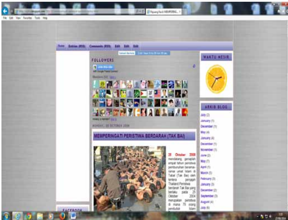
Rajah 7 http://najhie.blogspot.com/2008/10/memperingati-peristiwa-berdarah-takbai.html .

mempengaruhi emosi sedih, marah dan benci pembaca kepada pihak berkuasa di selatan Thailand.