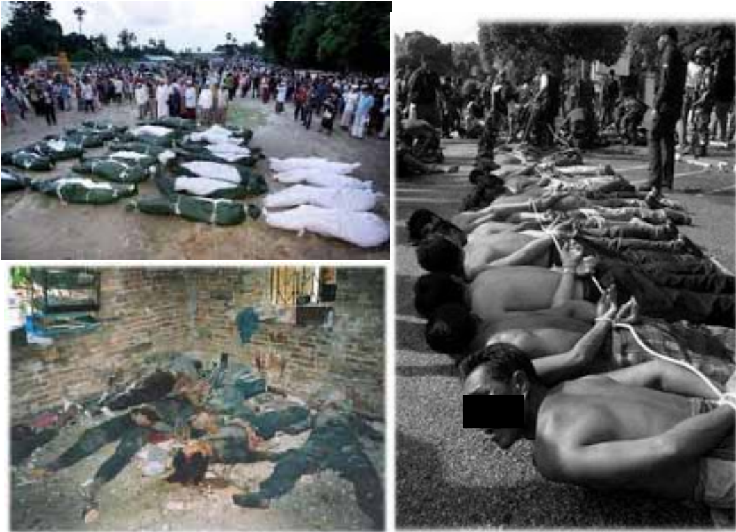
Rajah 2 Foto dalam laman web blog “Patani Darussalam Merdeka” ( http://pattanimerdeka.blogspot.com/ ).

Laman blog “Patani Darussalam Merdeka” juga memaparkan bahan yang dimuat naik dalam blog ini yang paling banyak dibaca oleh pembaca seperti yang digambarkan dalam Rajah 3. Ruangan “popular post” menunjukkan bahan yang paling banyak kali dibaca oleh pembaca blog ini. Berdasarkan data daripada “popular post”, bahan yang paling banyak dibaca berkisar tentang kekejaman yang diperlakukan oleh pihak keselamatan Thailand terhadap Melayu Patani. Bahan yang paling banyak dibaca menunjukkan bahawa strategi retorik yang bersifat provokatif yang bertujuan untuk mempengaruhi emosi pembaca oleh admin lawan blog ini ada kesannya. Strategi retorik “patos” yang memancing emosi pembaca dikonkritkan dengan pemilihan kata-kata dalam slogan laman blog “Patani Darussalam Merdeka”. Kata-kata itu termasuklah seperti, darah, air mata, Islam, malang dan Palestine. Kata-kata yang digunakan dalam slogan ini memancing emosi pembaca.