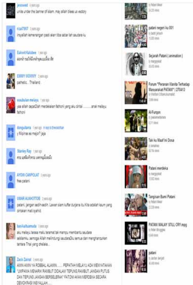
Rajah 13 Pautan video klip (termasuk puisi multimedia) yang terdapat dalam laman blog Aman Patani.

wilayah selatan Thailand. Emosi pembaca yang membaca laman sesawang akan terusik dan melalui strategik retorik etos, pembaca yang sebangsa dan seagama dengan Melayu Patani dipujuk untuk lebih sensitif dengan konflik Melayu Patani yang dilupakan.