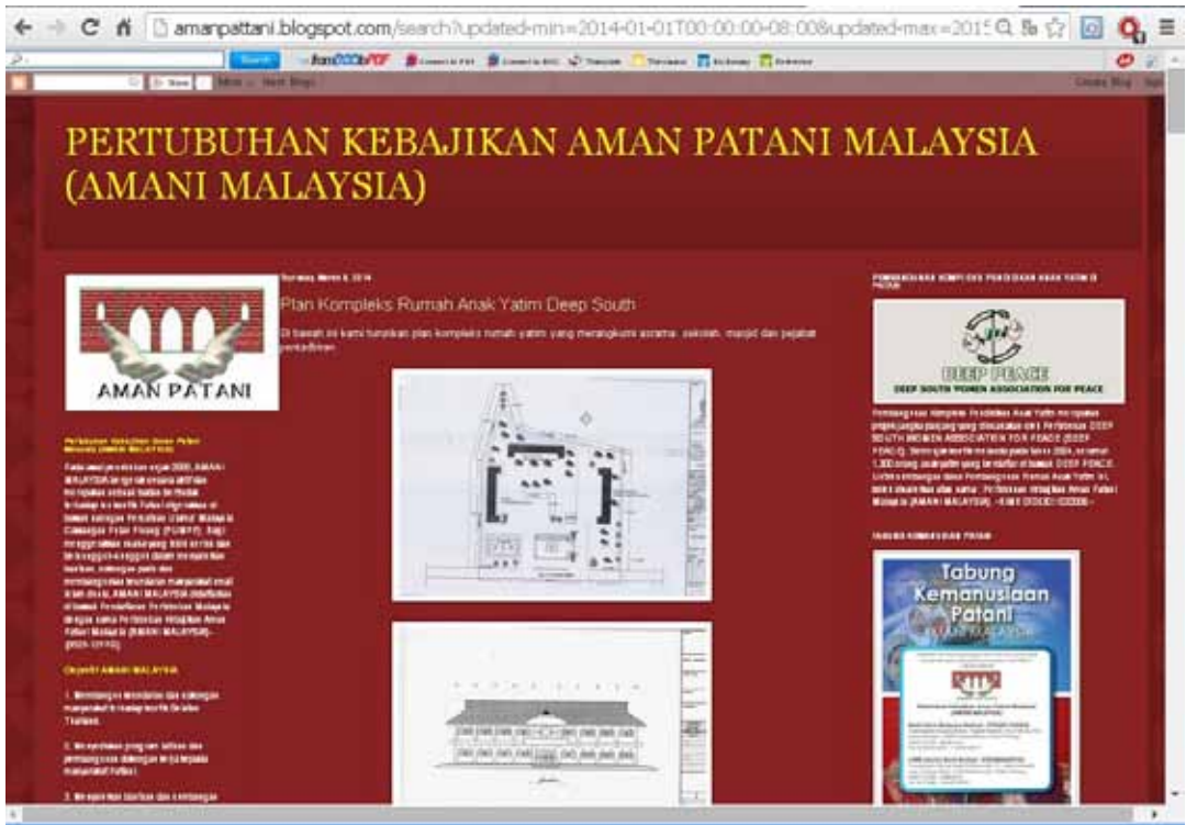
Rajah 11 Halaman depan laman blog Aman Patani ( http://amanpattani.blogspot.com/ ).

berhasrat Melayu Petani belajar daripada sejarah, berfikir dan mengambil iktibar daripadanya. Penulis menegaskan supaya sejarah pahit jangan berulang lagi.