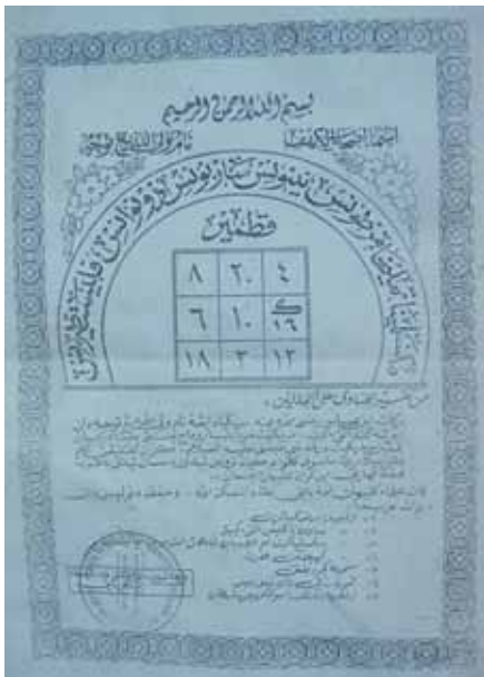
Rajah 5 Gambar foto wafak di sebuah kedai gunting rambut di Kepala Batas, Seberang Perai Utara, Pulau Pinang.

Wafak pelaris diambil gambar fotonya pada 12 Oktober 2012 di sebuah kedai gunting rambut di Paya Keladi, Kepala Batas, Seberang Perai Utara, Pulau Pinang. Pemilik kedainya, iaitu peniaga C memberitahu pengkaji bahawa, beliau mendapat