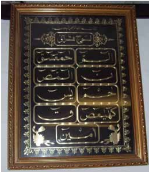
Rajah 3 Gantungan gambar kombinasi ayat al-muqattaat .