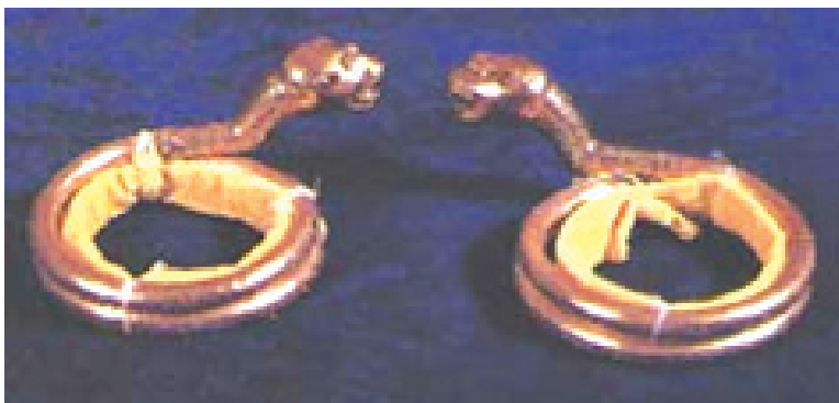
Rajah 4 Pontoh Ular Lidi.