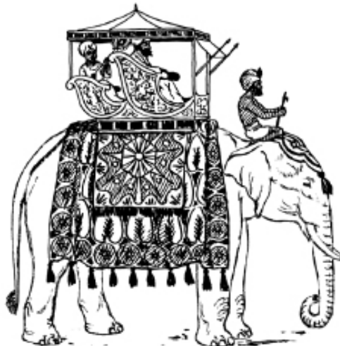
Rajah 9 Rengga.

Dalam hikayat Melayu, penggunaan rengga sering dikaitkan dengan gajah. Menunggang gajah pula hanya dikhaskan kepada golongan raja atau pembesar kerana penggunaan gajah melambangkan kemewahan dan status tinggi seseorang. Oleh sebab itu, kebiasaannya rengga dihiasi dengan indah dengan intan permata. Terdapat juga rengga yang dimiliki oleh para bangsawan ini diperbuat daripada logam yang mahal seperti emas. Dalam Sejarah Melayu, kerap kali diceritakan raja-raja menunggang gajah semasa pergi berburu atau pergi melawat negeri lain. 59