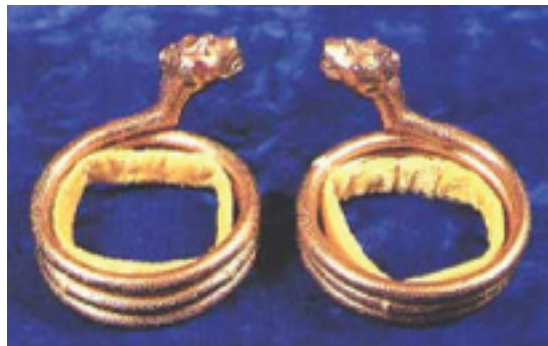
Rajah 3 Pontoh Bernaga.

Pontoh dalam teks tersebut bermaksud gelang besar daripada emas atau perak yang berukir naga atau merak yang dipakai di lengan di atas siku atau di atas pergelangan tangan. 17 Perhiasan pontoh ini merupakan salah satu daripada komponen set persalinan lengkap yang dianugerahkan oleh raja kepada orang tertentu yang menepati makna “pakaian selengkap” atau “peralatan lengkap”. Penganugerahan peralatan perhiasan yang terdiri daripada hiasan dahi dan pontoh pada pangkal lengan diberikan berdasarkan pangkat dan status masing-masing pada sepatutnya. Penerima anugerah darjah yang tinggi seperti Bendahara dan anak raja disimbolkan melalui perhiasan pontoh bernaga emas permata. Antara jenis pontoh yang lain termasuklah pontoh bernaga dengan penangkal dan azimat, pontoh berpenyangga sahaja, pontoh diperbuat daripada halkah biru dan pontoh yang diperbuat daripada perak. Semakin