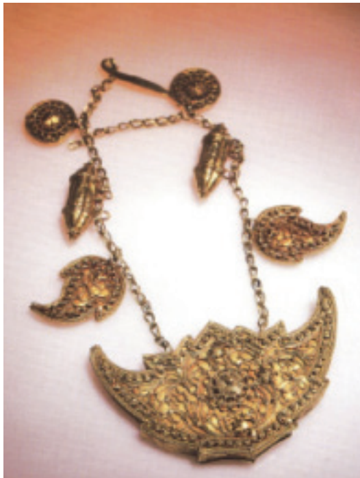
Rajah 5 Dokoh.

“Seresari” pula didefinisikan dalam kamus yang dirujuk oleh penulis dengan “sejenis kain”. 25 Maklumat terperinci tentangnya tidak diperoleh oleh penulis. Melalui semakan perkataan seresari dalam laman sesawang Malay Concordance Project, 26 perhiasan ini didapati telah disebut di dalam hikayat Melayu lama seperti Hikayat Aceh , Bustan al-Salatin dan Syair Bidasari . Melalui pengamatan penulis, seresari boleh dianggap sebagai sejenis kain yang berunsurkan kemewahan,