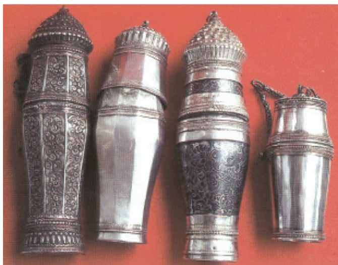
Rajah 1 Pekapuran.

Perkataan “pekapuran” di atas bermaksud bekas yang diperbuat daripada logam sebagai tempat mengisi kapur untuk disapu pada daun sirih. 6 “Halkah” pula bermaksud gelang 7 yang terdapat pada penutup bekas pekapuran tembaga tersebut dan badan pekapuran tersebut. Kedua-dua gelang tersebut dihubungkan dengan “rantai”. Pekapuran mempunyai pelbagai saiz dan bentuk seperti silinder, bujur, bulat, separa bulat, bersegi enam dan bersegi lapan. Pekapuran merupakan satu daripada komponen peralatan memakan sirih. Di sesetengah tempat, seperti