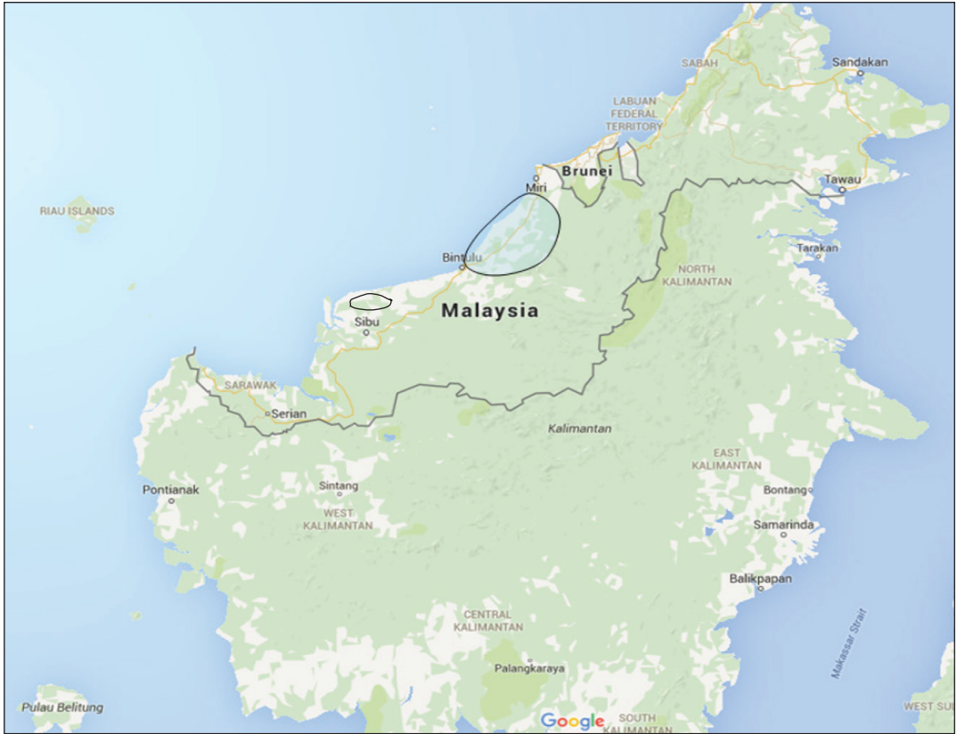
Rajah 2 Peta lokasi penelitian.