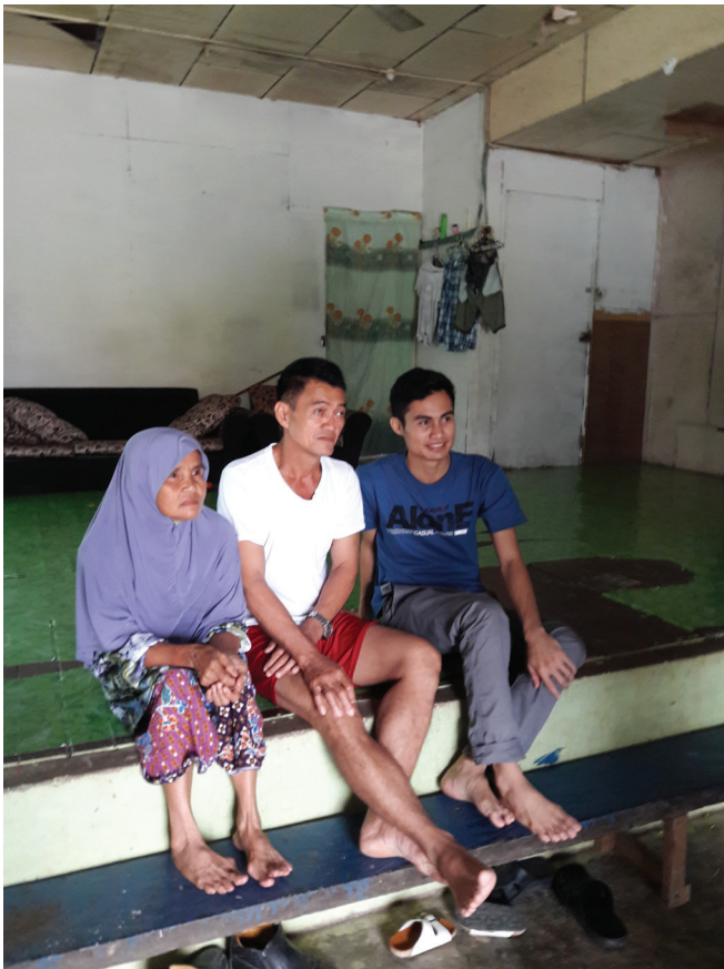
Rajah 3 Informan di Kampung Penan Muslim.

Di Sarawak, terdapat dua bahasa lingua franca utama, iaitu dialek Melayu dan bahasa Iban (lihat Azlan Mis, 2010). Dua bahasa yang berstatus lingua franca ini seharusnya memainkan peranan tertentu dalam isu pertukaran bahasa baharu suku Penan. Akan tetapi kenyataannya adalah sebaliknya kerana mereka memilih bahasa Bintulu. Faktor bahasa Iban tidak dipilih mungkin kerana tidak sejajar dengan agama mereka, walaupun kajian lapangan ini mendapati rata-rata orang Penan dewasa fasih berbahasa Iban. Dalam erti kata lain, bahasa Iban ialah bahasa ibunda suku Iban, yakni suku bukan beragama Islam dan pada ketika itu, banyak yang masih animisme. Tidak ada alasan untuk mereka menukar bahasa bukan Islam lain kerana bahasa Penan sendiri ialah “bahasa bukan Muslim”. Dialek Melayu pula walaupun “bahasa