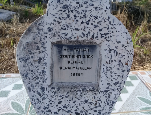
Rajah 5 Batu nisan yang menunjukkan terdapat suku Penan yang memeluk agama Islam sebelum tahun 1930an. Penemuan ini mungkin lebih awal daripada yang dilaporkan oleh Needham.

komuniti Penan Muslim dan Penan asli. Jika dipandang sekilas lalu, kampung yang bersambungan ini sukar dipastikan jenis keagamaan penduduknya kerana hanya gereja yang dibina di kampung ini dan surau pula terletak di seberang jalan, periferi komuniti Penan Muslim.