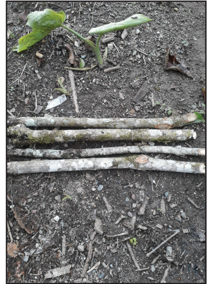
Rajah 2 Upacara magawoi .

Batang kayu dipancang atau diletakkan secara melintang. Suku Tindal di Kg. Kiau Nuluh menggunakan cara pacak sementara suku Bundu menggunakan cara melintang. Walau bagaimanapun kedua-dua cara boleh digunakan.