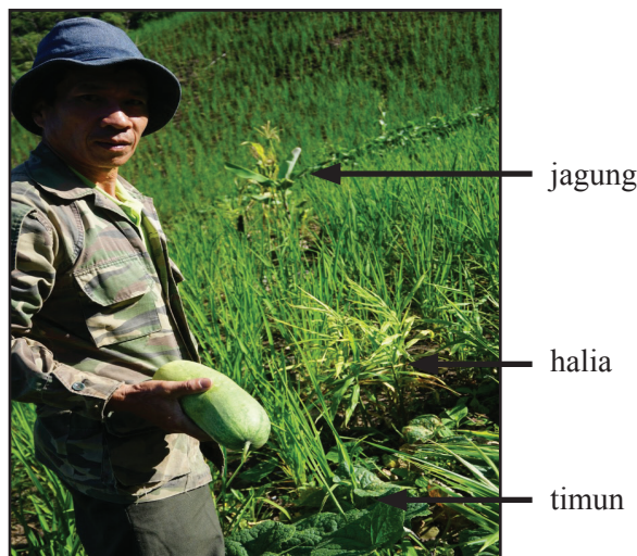
Rajah 4 Tanaman selang-seli.

Upacara madsalud (mantera khusus untuk padi yang mulai berisi) akan dijalankan sewaktu padi mulai bunting. Upacara ini akan dijalankan oleh bobolian atau pembantunya di tempat padi itu ditanam dengan membawa seekor ayam (Informan BT3). Beberapa helai bulu ayam akan dicabut dan diselitkan pada batang bambu yang dipacak atau pun dicucukkan pada daun-daun padi. Terdapat tiga jenis mantera yang diungkapkan semasa madsalud , iaitu monupi , monondiato dan mononluhut (Informan BT1). Ketiga-tiga mantera itu mempunyai tujuan yang sama, iaitu memohon bantuan Kinorohingan untuk menghalang turol do parai (kata-kata