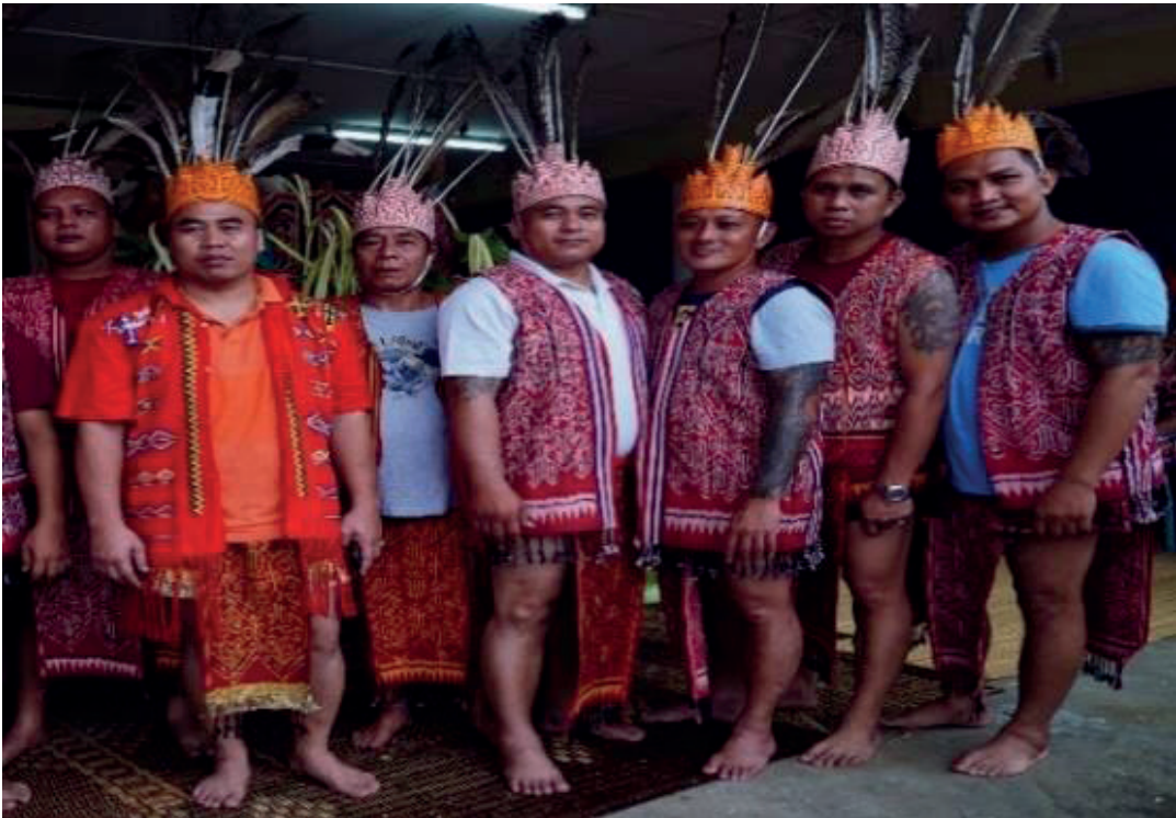
Rajah 6 Tatu berfungsi sebagai simbol identiti pengenalan diri masyarakat Iban.

Dalam erti kata lain, tradisi bertatu memperlihatkan peringkat umur seseorang individu tersebut seiring dengan peningkatan usia, iaitu daripada peringkat kanak-kanak kepada remaja, dewasa dan seterusnya tua. Dengan ini, tradisi bertatu berfungsi untuk melambangkan seseorang individu yang sudah melalui pelbagai cabaran dalam