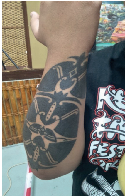
Rajah 4 Motif tatu berfungsi sebagai elemen perhiasan pada anggota badan.

Bagi golongan lelaki Iban, sekiranya mereka tidak mempunyai tatu pada bahagian badan, mereka dianggap seperti tidak berpakaian ataupun seperti rumah yang tidak beratap oleh komuniti mereka menurut informan 3 (77 tahun). Tatu berfungsi untuk