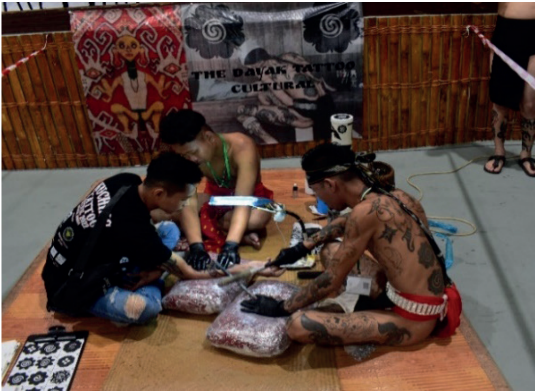
Rajah 1 Proses pembuatan tatu menggunakan kaedah tradisional.

tidak ingin Burung Bunsu Bubut kelihatan lebih cantik daripada dirinya. Burung Bunsu Ruai dengan sengaja telah mewarnakan badan Burung Bunsu Bubut dengan dakwat tatu bewarna hitam dan merah tanpa sebarang corak. Setelah menyedari perbuatan yang dilakukan oleh Burung Bunsu Ruai tersebut, Burung Bunsu Bubut berasa marah dan kecewa sehingga berlakunya pergaduhan antara mereka berdua. Jantau dan Nyanggau telah berusaha untuk menghentikan pergaduhan antara Burung Bunsu Bubut dan Burung Bunsu Ruai, namun tidak berjaya. Semasa berlakunya pergaduhan antara kedua-duanya, tiba-tiba berlaku kejadian yang aneh, iaitu Burung Bunsu Bubut dan Burung Bunsu Ruai bertukar menjadi burung dan terbang ke dalam hutan rimba. Rumah yang didiami oleh mereka berdua juga telah lenyap serta-merta. Setelah kejadian tersebut, Jantau dan Nyanggau pulang semula ke pondok mereka untuk meneruskan kegiatan pemburuan mereka. Jantau dan Nyanggau sangat