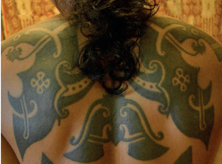
Rajah 5 Tatu berfungsi sebagai simbol identiti pengenalan diri masyarakat Iban.

menarik perhatian golongan wanita terhadap diri mereka serta memperlihatkan sifat kelelakian dan kematangan diri. Bagi golongan wanita pula, menurut beliau, tatu berfungsi sebagai perhiasan dan kecantikan diri untuk menarik perhatian lelaki terhadap diri mereka. Selain itu, tatu juga berfungsi untuk menandakan kemampuan mereka melaksanakan sesuatu tanggungjawab dan kewajipan sebagai isteri, serta berkebolehan dalam kegiatan menenun dan menari. Namun begitu, motif tatu khas yang dicacah pada golongan wanita Iban tidak banyak seperti golongan lelaki Iban. Motif tatu golongan wanita Iban bersaiz kecil berbanding dengan saiz motif tatu golongan lelaki Iban. Menurut informan 4 (68 tahun), tatu tersebut menggambarkan sifat golongan wanita Iban yang mempunyai perwatakan lemah lembut dan jiwa yang lebih halus, serta teliti dalam pelaksanaan sesuatu perkara. Menurut informan 4 lagi, tradisi bertatu yang terdapat dalam budaya masyarakat Iban adalah bertujuan untuk membawa unsur kecantikan, penyembuhan, perlindungan dan keberkatan dalam kehidupan seharian masyarakat Iban. Oleh itu, generasi tua masyarakat Iban amat mementingkan tanda tatu sebagai syarat utama dalam pencarian bakal menantu. Lambang tatu ini dapat menggambarkan diri individu Iban yang berkualiti dan dipercayai dapat membawa kesejahteraan hidup dalam hubungan suami isteri dan seterusnya keluarga.