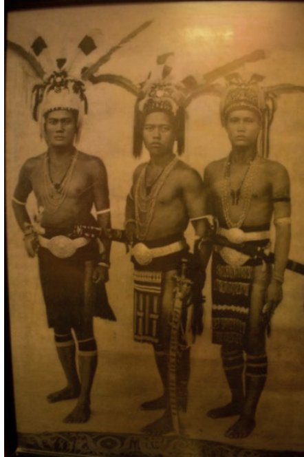
Rajah 3 Golongan pahlawan Iban bertatu menandakan mereka sudah melakukan ekspedisi ngayau.

membunuh seseorang tanpa sebarang tujuan yang jelas. Pengaruh dalam ekspedisi ngayau adalah disebabkan oleh beberapa faktor yang berkait rapat dengan status sosial, kepercayaan, dan kelangsungan hidup.