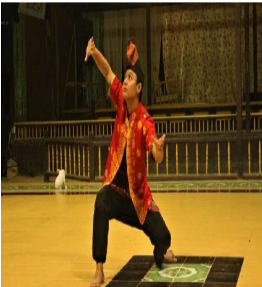
Rajah 15 Baju layang Perak.