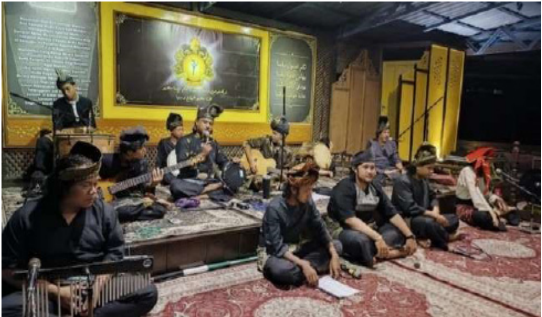
Rajah 3 Ahli kumpulan Dendang Anak Perak sedang melakukan persembahan.

Namun begitu, sebelum kumpulan Dendang Anak Perak memulakan persembahan kebudayaan pada Malam Melayu Sejati, terdapat satu keunikan yang dipersembahkan oleh masyarakat di Pulau Misa Melayu ini, iaitu lakonan semula istiadat menghadap raja (Rajah 4). Masyarakat yang terlibat dalam persembahan kebudayaan tersebut akan melakonkan semula istiadat menghadap raja dan apabila