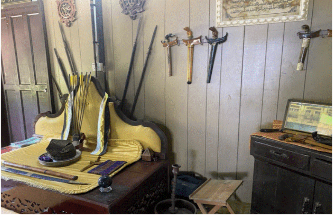
Rajah 13 Koleksi senjata yang dipamerkan di rumah Paduka Mahkota Yang Dipertuan.