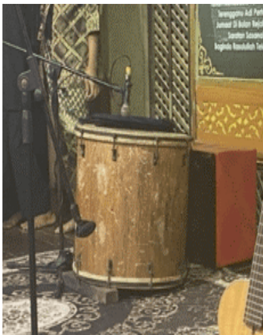
Rajah 5 Jidor.

Seterusnya, kumpulan Dendang Anak Perak ini menggunakan alat muzik bagi menghasilkan genre muzik tradisional Melayu dan berirama Melayu sejati untuk melakukan persembahan kebudayaan Malam Melayu Sejati. Penggunaan alat muzik ini sangat penting bagi menghasilkan alunan muzik dan menghidupkan lirik yang ingin disampaikan dengan lebih menarik. Kumpulan ini menggunakan campuran alat muzik, iaitu tradisional dan moden. Setiap ahli kumpulan tersebut mempunyai peranan yang tersendiri dalam memainkan alat muzik mengikut kemahiran masing-masing. Antara alat muzik yang digunakan termasuklah rebana Melayu, jidor (Rajah 5), gong, darbuka (Rajah 6), seruling, komping, gendang dan gitar. Selain itu, kumpulan muzik di Pulau Misa Melayu ini juga turut mengadakan bengkel pengenalan asas latihan alat muzik tradisional Melayu kepada masyarakat yang ingin belajar tentang alat muzik. Bengkel ini memberikan taklimat berkaitan dengan pengenalan asas irama, rentak alunan muzik dan cara bermain alatan muzik tradisional dengan betul.