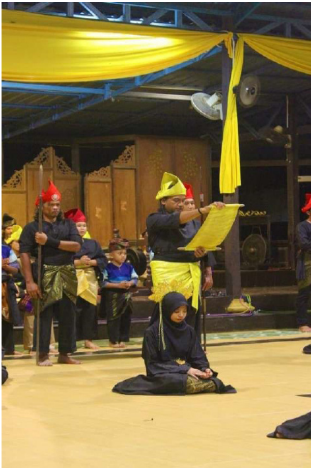
Rajah 4 Lakonan semula istiadat masuk menghadap raja.

Setelah selesai melakonkan istiadat menghadap raja, persembahan kebudayaan akan bermula. Setiap persembahan yang disampaikan mempunyai mesej yang tersendiri. Terdapat banyak lagu yang dipersembahkan oleh Kumpulan Dendang Anak Perak. Lagu-lagu yang dipersembahkan oleh kumpulan tersebut adalah dengan genre muzik tradisional Melayu dan irama Melayu sejati seperti ghazal, inang, joget, dan