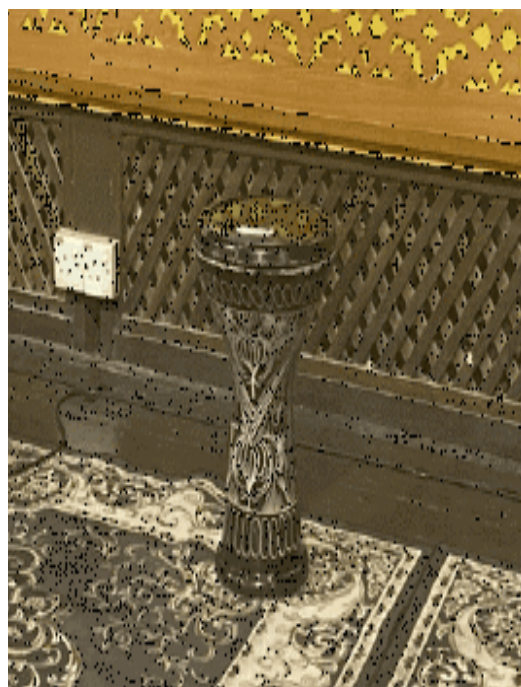
Rajah 6 Darbuka.