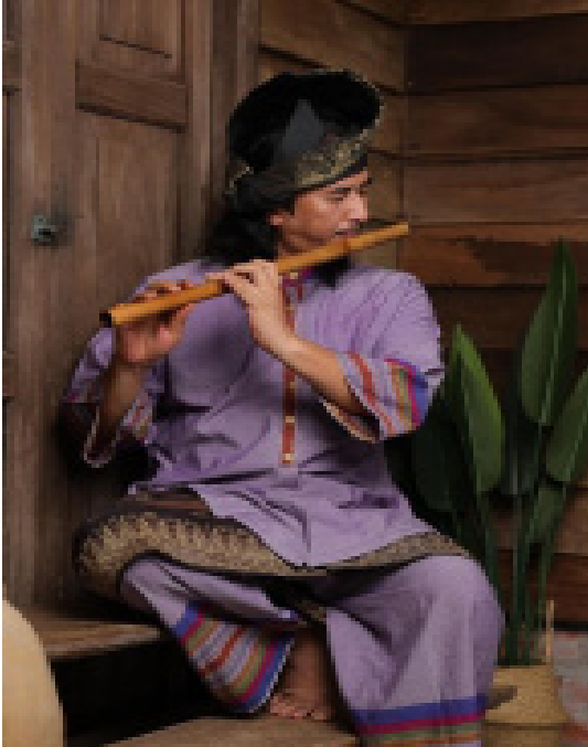
Rajah 14 Baju Sikap Perak.