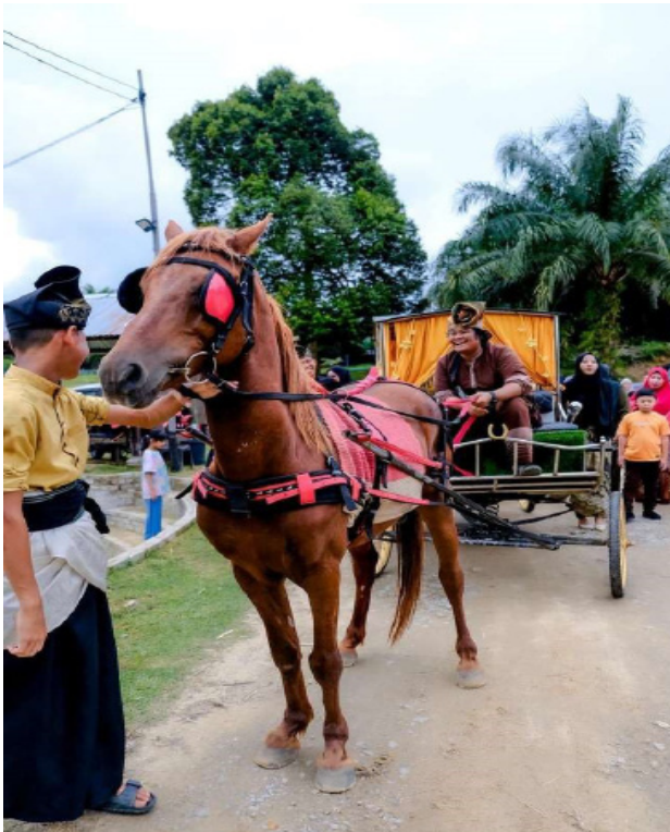
Rajah 9 Kereta kuda yang digunakan semasa adat perkahwinan.

Melayu ini sangat unik kerana mengikut adat istiadat Melayu klasik seperti pemakaian, makanan, dan sebagainya. Selain itu, majlis perkahwinan ini juga dimeriahkan dengan persembahan berbalas pantun, seni pencak silat, gendang Melayu, alunan kompang, tarian Melayu dan sebagainya. Pengantin yang diraikan kebiasaannya akan diarak bersama alunan kompang sehingga ke pelamin. Alunan kompang ini akan dipalu oleh Kumpulan Dendang Anak Perak bertujuan untuk menghidupkan suasana majlis perkahwinan dan memaklumkan tetamu yang hadir mengenai ketibaan pengantin. Seterusnya, pengantin akan menaiki kereta kuda semasa berarak seperti yang ditunjukkan dalam Rajah 9. Kereta kuda merupakan kenderaan yang berguna pada zaman dahulu dan selalu digunakan oleh golongan diraja, bangsawan dan peniaga. Selain itu, pengantin juga akan berbusana songket dan diraikan dengan persembahan seni pencak silat Melayu. Penerusan adat perkahwinan tradisional ini membantu mengangkat martabat warisan budaya Melayu yang semakin hari dicampur aduk dengan budaya moden yang dibawa dari luar.