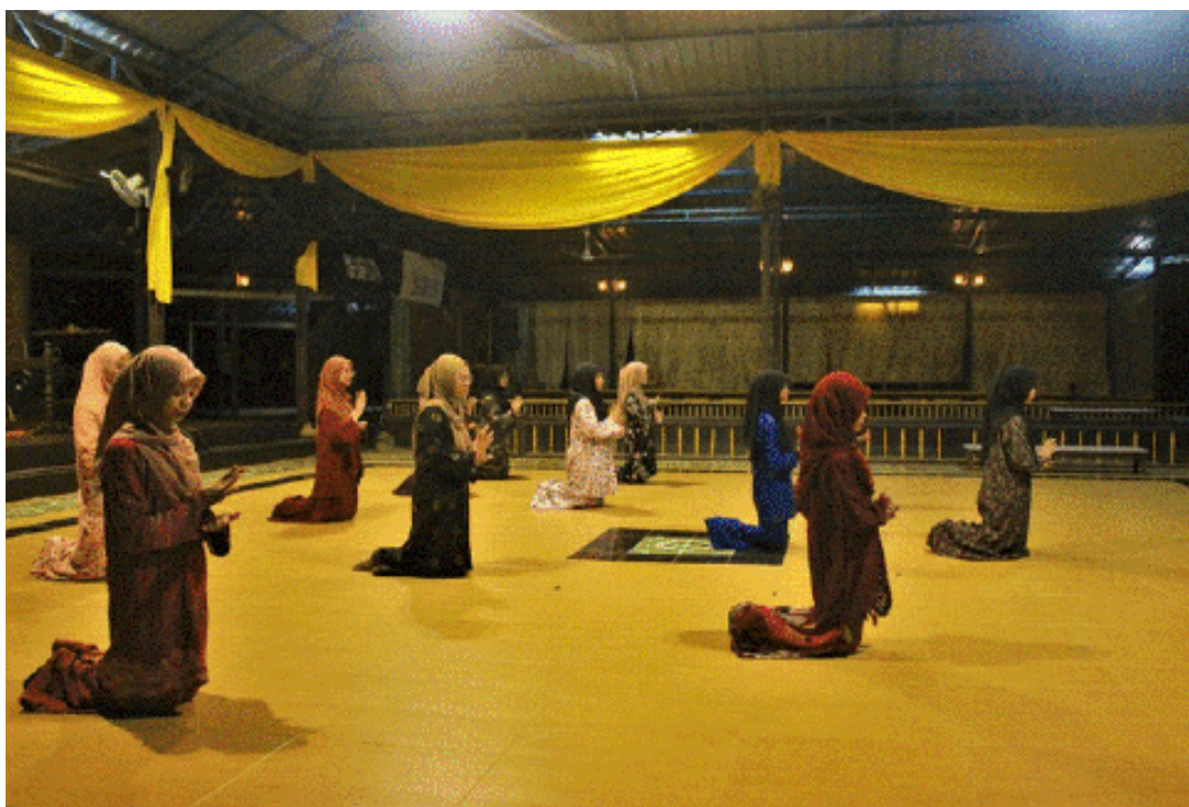
Rajah 7 Penari sedang melakukan persembahan semasa Malam Melayu Sejati berlangsung.

Berdasarkan pelbagai elemen seni persembahan yang diterangkan, peranan Perkampungan Misa Melayu dalam mengangkat martabat budaya dan warisan Melayu yang kian pupus dapat dilihat secara tidak langsung melalui persembahan lakonan istiadat menghadap raja, penerapan lagu berunsur nasihat, penggunaan alat muzik tradisional dan persembahan seni tarian tradisional Melayu dan sebagai platform untuk persembahan seni teater oleh komuniti luar.