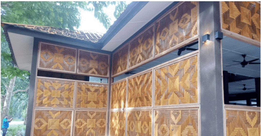
Rajah 11 Surau Pulau Misa Melayu yang dikelilingi dengan dinding kelarai tepas.

Selain itu, surau ini juga menjadi tempat untuk menjalankan bengkel seperti bengkel tengkolok Melayu seperti dalam Rajah 12. Tengkolok Melayu merupakan sejenis alas kepala tradisional Melayu yang dipakai oleh golongan lelaki dan menjadi sebahagian daripada pakaian harian masyarakat terdahulu. Pemakaian tengkolok ini merupakan pakaian golongan diraja dan bangsawan serta dikategorikan sebagai pakaian tradisional. Pulau Misa Melayu menjalankan bengkel sebegini untuk meningkatkan pengetahuan masyarakat setempat mengenai budaya Melayu.