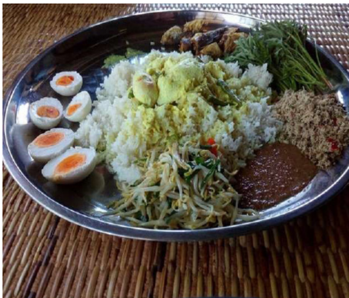
Rajah 8 Hidangan dalam talam.

Elemen makanan tradisional yang terdapat di perkampungan ini juga sedikit sebanyak membantu memperkenalkan dan menyebarkan luas warisan budaya masyarakat Melayu kepada masyarakat luar, di samping mengekalkan resipi warisan turun-temurun untuk diwarisi oleh generasi pelapis seterusnya.