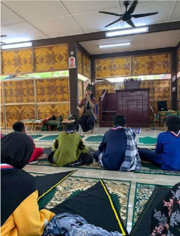
Rajah 12 Bengkel tengkolok Melayu di surau.