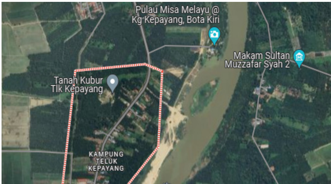
Rajah 1 Peta Kampung Teluk Kepayang, Bota Kiri, Perak dan Pulau Misa Melayu.

Kewujudan sebuah perkampungan di Kampung Teluk Kepayang, Bota Kiri, Perak yang masih memartabatkan budaya Melayu, iaitu Pulau Misa Melayu menjadi daya penarik untuk menyebarluaskan pengetahuan tentang kebudayaan Melayu dan secara tidak langsung dapat membantu merancakkan industri pelancongan di negeri Perak (Bernama, 2018). Pulau Misa Melayu ini berada di atas pulau dan sering menjadi lokasi pertemuan bagi sebarang penganjuran aktiviti kebudayaan (Bernama, 2018). Tujuan tempat ini diwujudkan untuk menghidupkan kembali budaya Melayu dalam kalangan masyarakat terutamanya kepada generasi akan datang supaya tidak lapuk dek zaman (Bernama, 2018). Pelbagai aktiviti yang berunsurkan budaya Melayu dijalankan oleh tempat ini bagi menarik masyarakat serta menghidupkan suasana tempat tersebut menjadi lebih meriah. Rajah 1 menunjukkan peta Kampung Teluk Kepayang, Bota Kiri, Perak dan Pulau Misa Melayu.