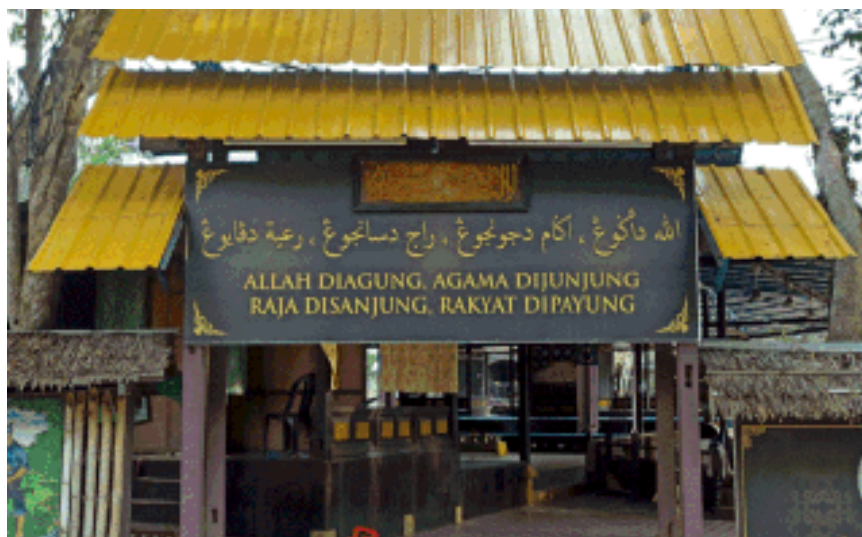
Rajah 10 Pintu masuk Balairung Seri

Balairung Seri yang terdapat di Pulau Misa Melayu ini merupakan prasarana seni yang penting kepada masyarakat di perkampungan tersebut. Hal ini demikian kerana hampir kesemua aktiviti kebudayaan dijalankan di Balairung Seri seperti persembahan kebudayaan Malam Melayu Sejati, bengkel, majlis keramaian, aktiviti harian dan sebagainya. Prasarana seni ini juga merupakan tempat masyarakat di Pulau Misa Melayu berkumpul. Balairung Seri ini diperbuat daripada kayu yang menunjukkan seni bina tradisional Melayu.