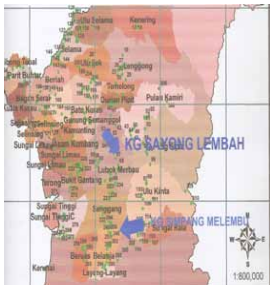
Rajah 2 Peta negeri Perak.

Kampung Sayong Lembah pula terletak dalam mukim Sayong yang mempunyai 18 718 orang penduduk dan berkeluasan 16 422.5 hektar.