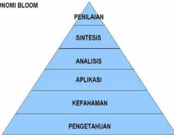
Rajah 1 Model Taksonomi Bloom 1956.