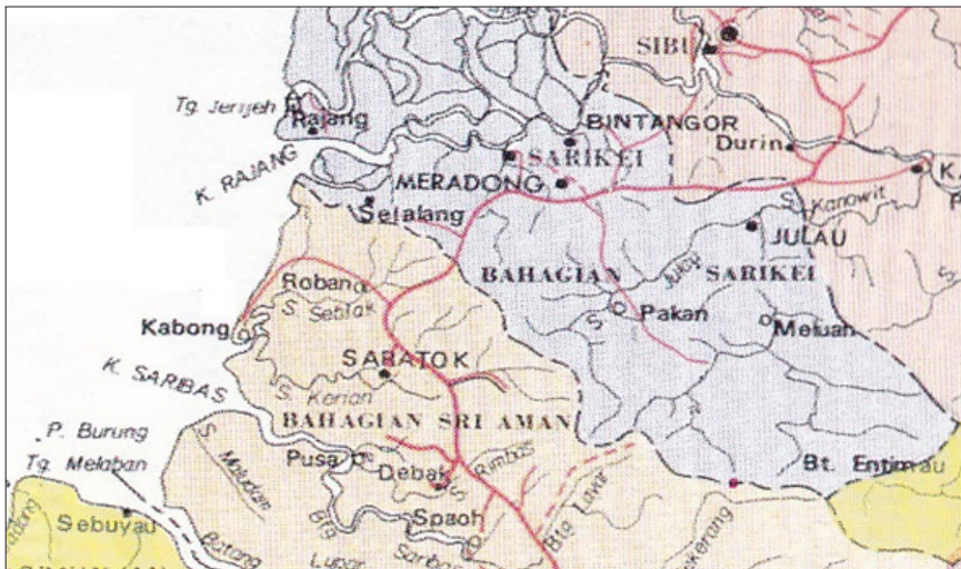
Rajah 1 Lokasi Sungai Saribas, Krian dan Rejang.