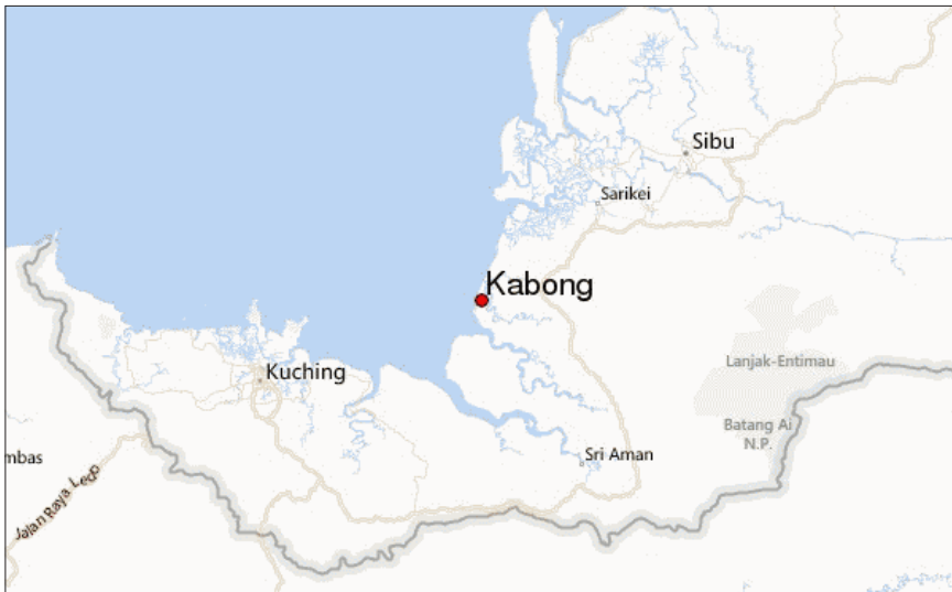
Rajah 1 Kedudukan daerah kecil Kabong.