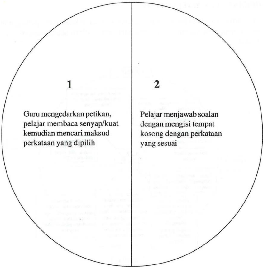
Rajah 3 Model Pengajaran Tradisional.